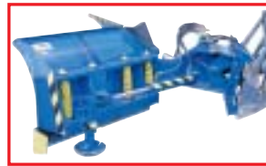
Tukijalan säätö portaattomasti ruuvilla