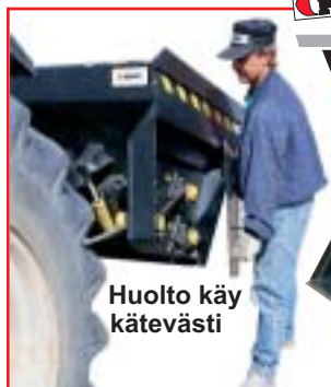
Huolto käy kätevästi