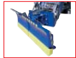
Terä joustaa 45° Työntörungon kallistus maaston mukaan